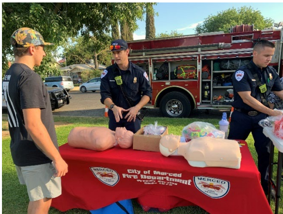
Daim duab 1. Qhia siv tes ua CPR

Lub Tuam Tsev Tua Hluav Taws tau tsim tsa thiab pab cov pej xeeb Merced tshaj 150 xyoo. Muaj kev pab ua ntej rau tus neeg, coj lub zej zog mus raws sij hawm ntawm qhov xav tau thiab txhob muaj teeb meem, thiab ua kev phooj ywg kom ntev mus raws li lub hom phiaj txij li tau tsim tsa lub koom haum. Lub hom phiaj no kuj muaj nuj nqis rau cov mej zeej tej kev nyuaj siab, qhov hawj lwm MFD yuav txhawb tej thaj tsam ntawm nrog rau ALS kom txhua mus rau peb tej kev ua lag luam kev ntxhov siab, thiab tus tib neeg. Raws li Merced tau loj hlob mus li 150 tom ntej qhov kev pab xav tau ua ntej thiab muaj kev thooj siab koom ntsws yuav yog ib yam tseem ceeb tshaj