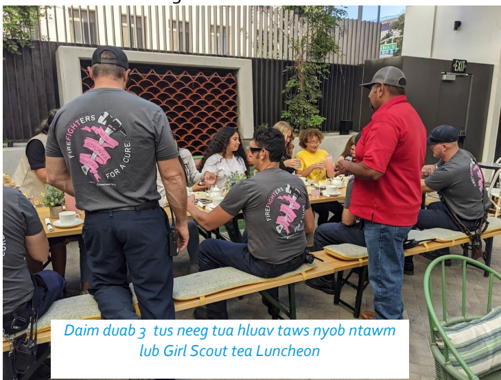
Daim duab 3 tus neeg tua hluav taws nyob ntawm lub Girl Scout tea Luncheon

Merced CERT yog tsim tsa los pab txhawb lub caij muaj xwm txheej thiab koob tsheej. MFD yuav tau sib zog ua ntxiv rau kev tawm sab