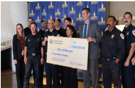
Daim duab 2 Lub Xeeb Pob Nyiaj Pab los ntawm Tus Senator Anna Caballero

Txoj kev saib xyuas tej nyiaj pab kom muaj kev nyab xeeb yog ib qho nyuaj kawg. Txoj kev yuav siv tej nyiaj uas tau los txhawb rau tej kev pab rau lub zej zog yog ib kauj ruam ua nyuaj kawg zoo li Merced. MFD yuav tsum kom rau kev saib xyuas kub ntxhov ntawm tsoom fww (FEMA) qhov nyiaj pab rau cov neeg tua hluas taws (AFG) kom zoo rau txoj kev saib xyuas tej hluav taws kub hnyiab thiab xwm txheej kub ntxhov ntawm tej kev pab (SAFER). Ntxiv mus tej nyiaj pab me me yog yuav los tsim tsa tej kev pab qee zaum kom muaj txawm peem thiab muaj nyiaj pab ntxiv rau ntawm tej lub xyoo.