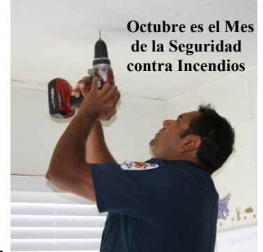
Octubre es el Mes de la Seguridad contra Incendios

Los bomberos irán al hogar o casa móvil e identificarán cuantas y donde